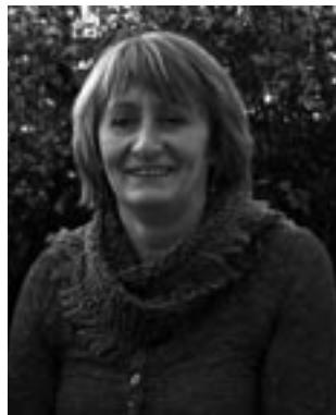
ジュディス・ステインズ (Judith Staines)

作家・研究者。イギリスを拠点として、EU文化協力、国際モビリティ分野を専門とする。IETMをはじめ、EU文化協力プロジェクトに参加し、舞台芸術国際モビリティのサイト www.on-the-move.org の編集長を務めている。2008年はInternational Foundations and Networks initiatives の研究者として活動。著書には、EU・ロシア間の文化財の移動について、またイギリス内のヴィジュアル・アーティスト向けハンドブックなどがある。