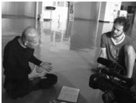
稽古風景(別府国際観光港にて)