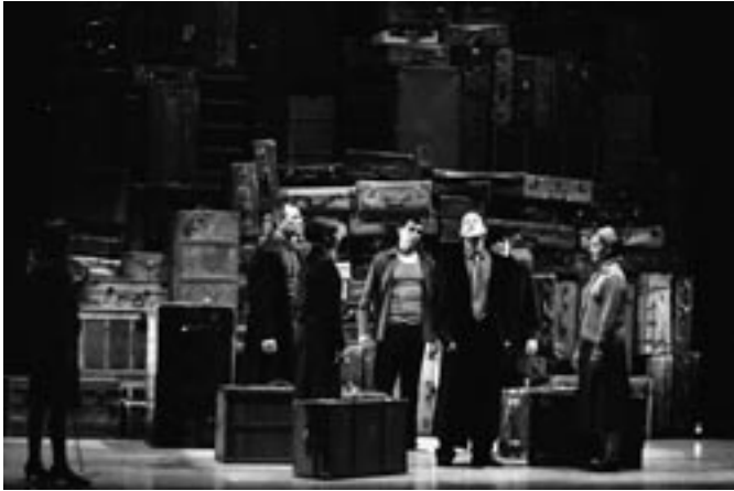
Temory Miseria del Tercer Reich [第三帝国の恐怖と悲惨] (2008年5月Teatro Principal スペインのサラゴサにて) 原作: Bertolt Brecht 演出: Jesús Arbués 製作: Centro Dramático de Aragón Photo: Marta Marco www.centrodramaticoaragon.com

Research)*2と欧州評議会(The Council of Europe)*3の共同事業です。