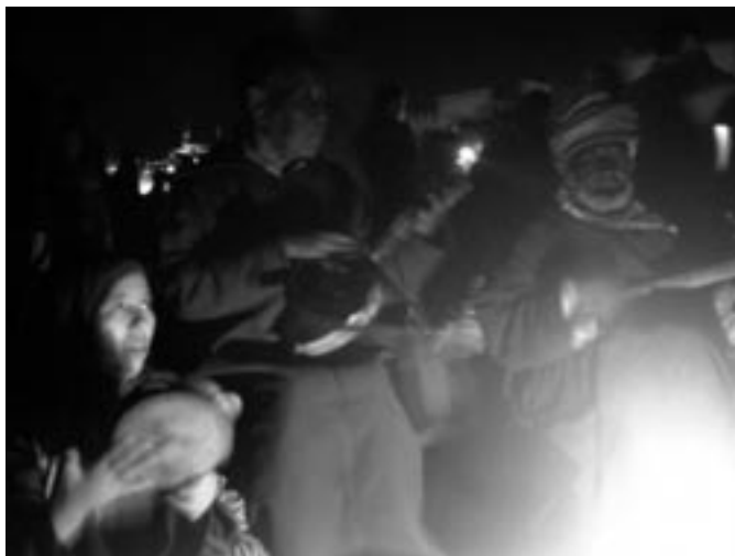
フナ広場のベルベル音楽の三人

いて近づくにつれ、徐々に、太鼓やチャルメラ、人々の歓声が、うねったように大きくなってきて、興奮が高まってきた。