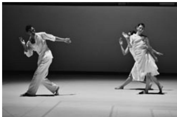
ROSAS, Raga for the Rainy Season / A Love Supreme (2005年5月)

イタリアでは、舞台芸術への政府の支援は、文化財・文化活動省(MIBAC—Ministero per i Beni e le Attività Culturali) ★14 から、