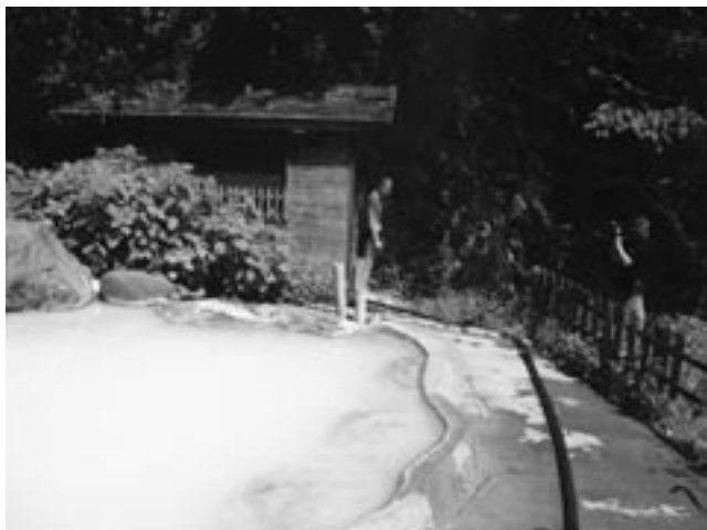
ドキュメンタリーの撮影（別府・いちのいで会館にて）