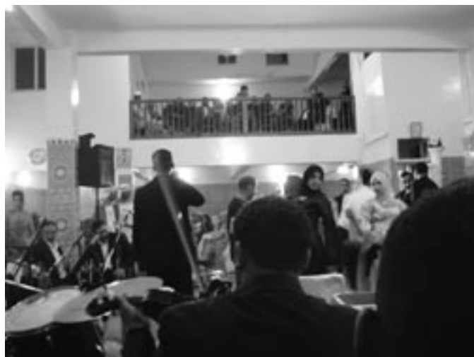
結婚式で踊る人達

僕等のやっている鉄割アルバトロケットは、寸劇のようなものや、変な踊りや、変な動き、音楽を、矢継ぎ早に繋いでいくような、パフォーマンスなのですが、これはまさしく、フナ広場で行なわれていたパフォーマンスをゴツ煮にしたようなもので、もちろんフナ広場の方がプロフェッショナルであるけれど、結局思ったのは、新しい試みよりも、オーソドックスを目差し、崇高な表現を求めず、しかし下卑た感じにはならず、でも胡散臭くて、ド素人感漂う熱や、突発的なプロフェッショナルさ…うんぬんかんぬんと、今、書けば書くほどわけわからなくなってきているこの状況なのですが、こんな感じのことをやりたいのです。そして、モロッコで、見たり体験したことは、それら全てが詰まっっていて、結局は、やりたい衝動があれば、なんでもありなんだと思いました。あとは続けることで、自分でやったなにかに、自分で呆気にとられてしまったら、本望です。