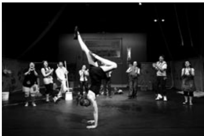
Grund (2008年4月 Casa del Teatro Ragazzi e Giovani イタリアのトリノにて) 作: Graziano Melano, Vanni Zanola 演出: Graziano Melano Photo: Giorgio Sottile www.fondazionetr.it