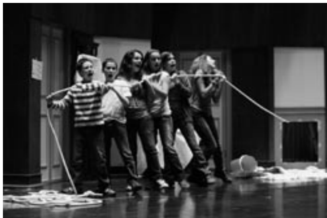
Let's make an opera リハーサル風景(2009年6月ポルトガルにて) 作: Benjamin Britten

劇場のインフラに関してポルトガルには特有の課題があります。ポルトガルがECに加盟して以降、1990年代後半から10年の間にEUの構造基金(計画的補助金)が流れ込み、国中で多くの劇場が建築あるいは改装されました。地方自治体はEUの助成に相応する資金提供を行いました。この事が一時的に巨大なインフラを作り出しましたが、この投資に、プログラミングやプロフェッショナルな運営態勢